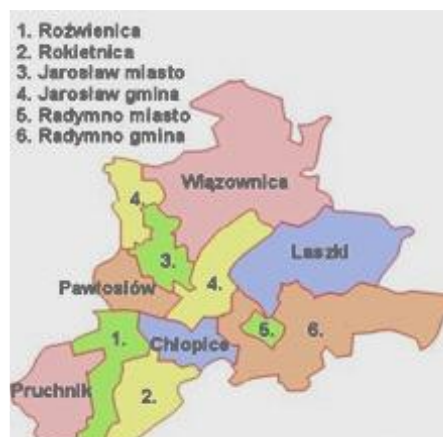
Rysunek 2: Gminy sąsiadujące

Powierzchnia miasta wynosi 34,46 km 2 , co stanowi 3,4% powierzchni powiatu i 0,2% powierzchni województwa. 72% powierzchni gminy stanowią użytki rolne. Biorąc to pod uwagę dość wysokie - na tle województwa - zaludnienie miasta, należy przyjąć, że centrum miasta jest obszarem silnie zurbanizowanym.