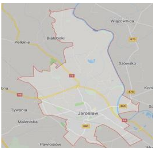
Rysunek 1: Granice miasta

Geograficznie Jarosław jest zlokalizowany we wschodniej części województwa podkarpackiego. Miasto położone jest na pograniczu Podgórze Rzeszowskiego (zwanego również Podgórzem Jarosławskim) i Doliny Dolnego Sanu, leży w sąsiedztwie trzech gmin wiejskich: Jarosław, Wiązownica i Pawłosiów. Położone jest na przebiegu ważnych szlaków komunikacyjnych Polski południowej. Jarosław oddalony jest 55 km od Rzeszowa (układem drogowym) oraz 59 km od lotniska w Jasionce k. Rzeszowa. Od przejścia granicznego z Ukrainą w Korczowej Jarosław dzieli zaledwie 36 km. Ważnymi elementami układu drogowego są przebiegająca od południowej strony miasta autostrada A4 (będąca elementem trasy europejskiej E40) w kierunku wschód-zachód (biegnąca od Jędrzychowic przy granicy z Niemcami do przejścia granicznego z Ukrainą w Korczowej) oraz - w kierunku północ-południe - droga krajowa nr 77. W związku z bliskością autostrady, niedaleko miasta znajdują się dwa węzły autostradowe: Jarosław Zachód (łączy autostradę z drogą krajową nr 94) i Jarosław Wschód (łączy autostradę z drogą wojewódzką nr 880). Natomiast od strony północnej miasta biegnie droga krajowa nr 94, będąca alternatywną trasą dla autostrady. W 2012 r. otwarto obwodnicę miasta Jarosławia.