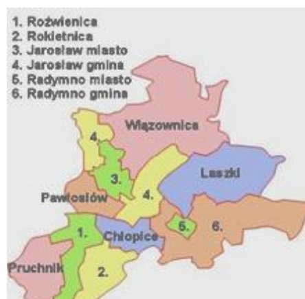
Rysunek 2: Gminy sąsiadujące

Powierzchnia miasta wynosi 34,46 km 2 , co stanowi 3,4% powierzchni powiatu i 0,2% powierzchni województwa. 72% powierzchni gminy stanowią użytki rolne. Biorąc to pod uwagę oraz dość wysokie - na tle województwa - zaludnienie miasta, należy przyjąć, że centrum miasta jest obszarem silnie zurbanizowanym.